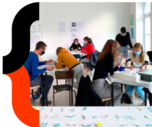
Fantastique Atlas, Laval 2020

Afin de permettre à tous de suivre le déroulement des résidences, chaque binôme créera et alimentera un site/blog dédié à la résidence et produira un support de synthèse présentant leur démarche et leurs réalisations.