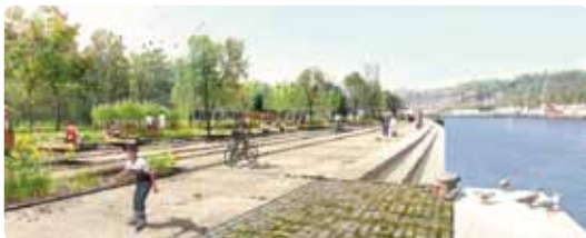
© Atelier Jacqueline Osty et Associés

Nombre de places limité - Inscription au 02 35 71 85 45