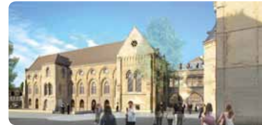
© Florence et François Jacquemard 2 Architectes