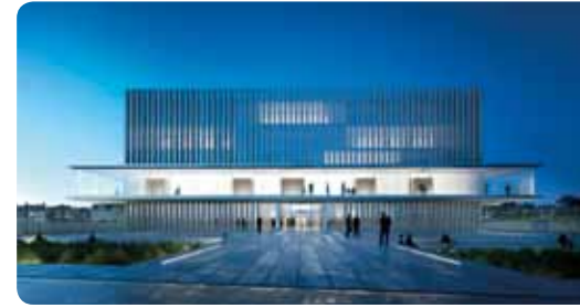
© Architectes BE Hauvette Paris, Atelier d'Architecture Pierre Champenois