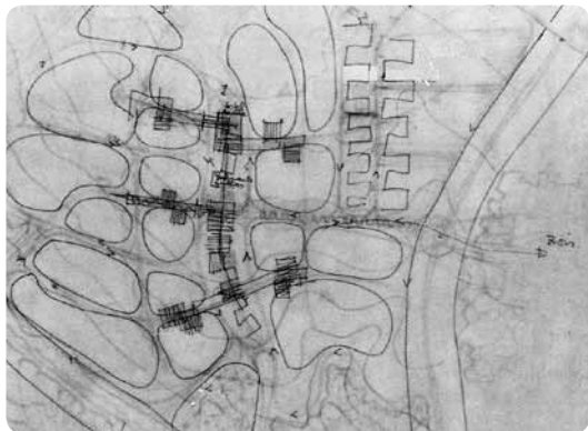
© Union des Architectes et Urbanistes de Paris

Renseignements : Maison des Projets, avenue de la Grande Cavée 02 31 95 28 37 - maisondesprojets@herouville.net