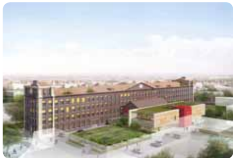
© Reichen et Robert et associés

RDV à l'ancienne caserne Tallandier, à l'entrée du chantier rue Ampère Nombre de place limité - Inscriptions : 02 35 71 85 45