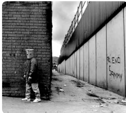
Belfast, Irlande du Nord. Juillet 1997.

Bibliothèque universitaire – 25 rue Ph. Lebon Du lundi au vendredi de 8h30 à 19h, le samedi de 10h à 18h Renseignements : 02 32 74 44 14