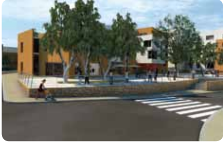
© AMS Michel Sari - GERA