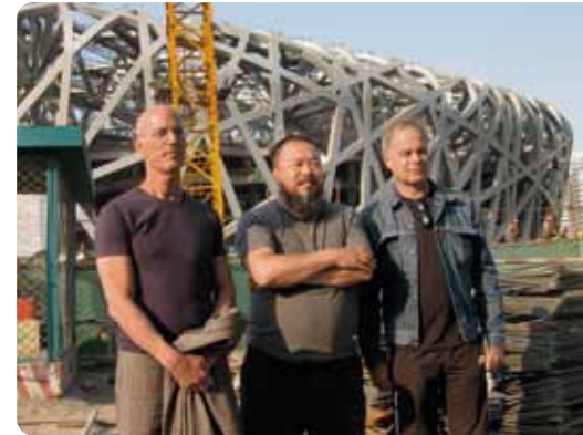
© 2008 by T&amp;C Film AG. All rights reserved.