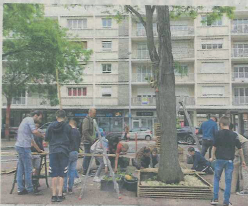
Un atelier de végétalisation du quartier des Quatrans, organisé par l'association Territoires Pionniers - Maison de l'architecture de Normandie.