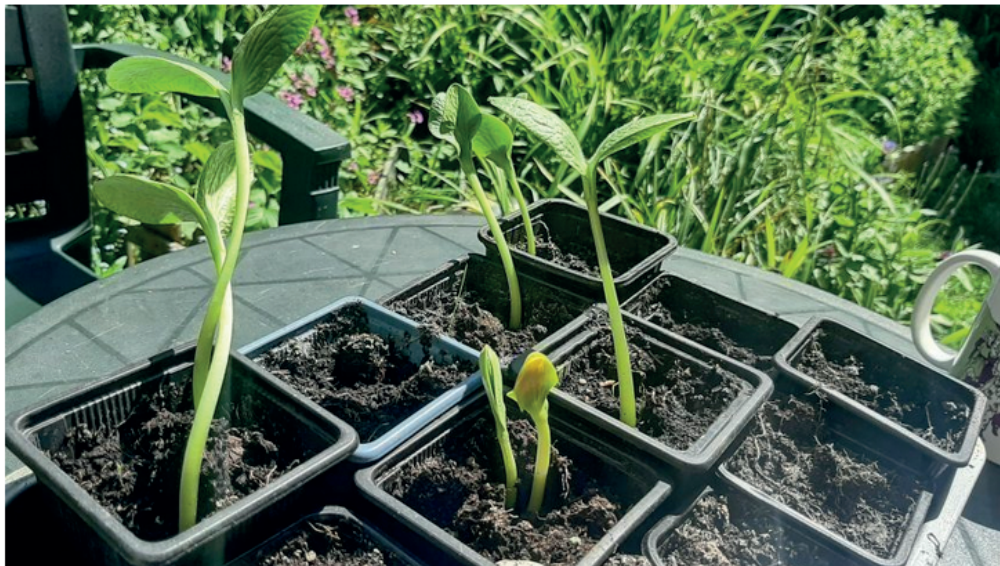
L'équipe de Territoires pionniers, de la maison de l'Architecture de Caen (Calvados) propose un atelier bricolage et jardinage le jeudi 25 juin 2020.

Envie de jardiner en plein centre-ville de Caen (Calvados) , au cœur de l'hypercentre, dans le quartier des Quatrans ? Aucun problème avec ce rendez-vous organisé par la maison de l'Architecture. Un atelier de jardinage participatif pour (re)mettre les mains dans la terre, mais aussi pour venir collecter de précieux conseils de végétalisation de l'espace urbain. Les membres de Territoires pionniers, de la Maison de l'architecture, précisent :