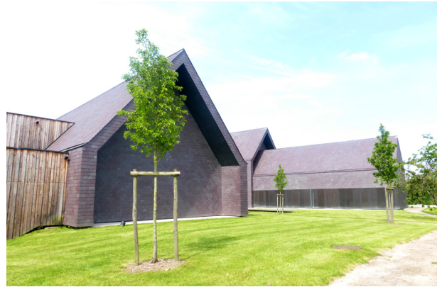
L'Atelier, médiathèque de Gournay-en-Bray / AAVP Architecture

Accompagnateurs : Jean-Marc Coubé (CAUE 27), Juliette Dessert (CAUE 27), Annicka Julien (architecte), Michel Rousset (CAUE 27), Johanna Sery (ENSA Normandie)