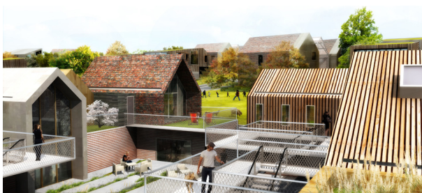
OHISOM ARCHITECTES - Prairie urbaine - Sheep meadow - Projet mentionné

Exposition des projets lauréats de l'appel à idées Habiter le Pays d'Auge au XXI e siècle organisé par Pays d'Auge Expansion et le CAUE du Calvados (2011)