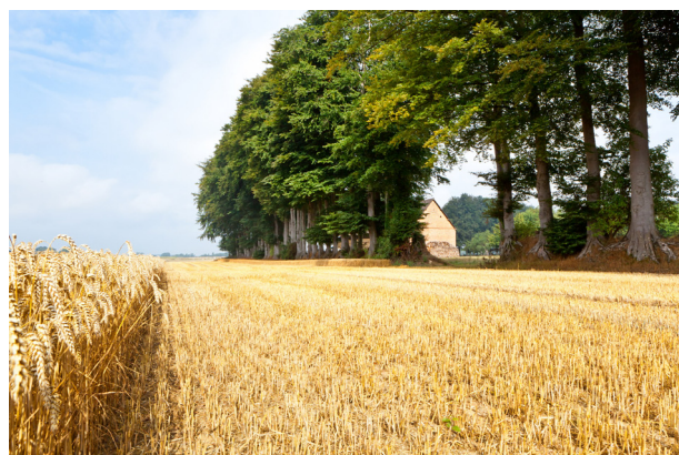
Clos-masure du Pays de Caux