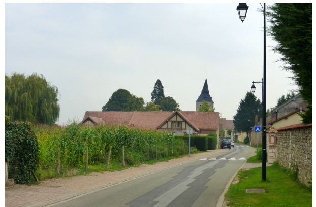
Heudebouville

20H30 | Conférence Hervé Le Bras Le défi des territoires : le passé culturel face au présent économique et social Espace h2o