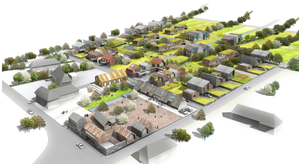
OHISOM ARCHITECTES - Prairie urbaine - Sheep meadow - Projet mentionné