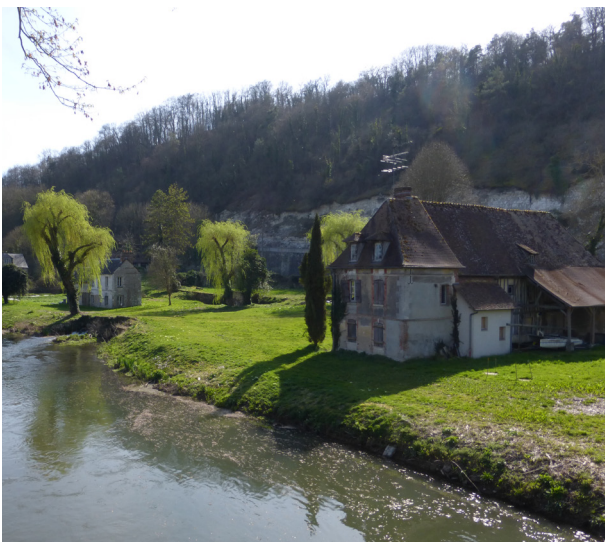
Les bords de l'Eure

L'espace rural est depuis un demi-siècle soumis à des phénomènes d'ordre métropolitain. Ses territoires sont traversés par des flux de plus en plus intenses. Sa planification et sa gouvernance sont conditionnées par des centralités de plus en plus fortes, des compétences techniques de plus en plus mutualisées. Ses formes bâties, neuves et anciennes, s'homogénéisent et ses paysages se banalisent. En conséquence, la nature de la campagne, historiquement agricole, s'est multipliée : résidentielle dans les zones périurbaines et touristiques, qualifiée de nouvelle quand elle accueille de nouveaux types de résidents, venus d'autres horizons, ou fragile lorsqu'elle conserve son affectation première. Mais en dépit de ces phénomènes, la mort du rural ne peut être constatée. Bien au contraire, loin de subir sans réagir à la métropolisation, ses habitants, ses acteurs s'en nourrissent. Soucieux de préserver un cadre de vie plébiscité mais perpétuellement menacé, de conforter une valeur économique réelle en dépit des effets de la mondialisation, ils mettent en place des alternatives aux dysfonctionnements, aux obstacles et expérimentent de nouvelles pratiques. Ce sont ces initiatives, et ce dans trois domaines essentiels : les flux et les mobilités, la concertation et les formes bâties, que les 6 èmes rencontres mettent en valeur à travers conférences, expositions, visites de terrain et journée scientifique.